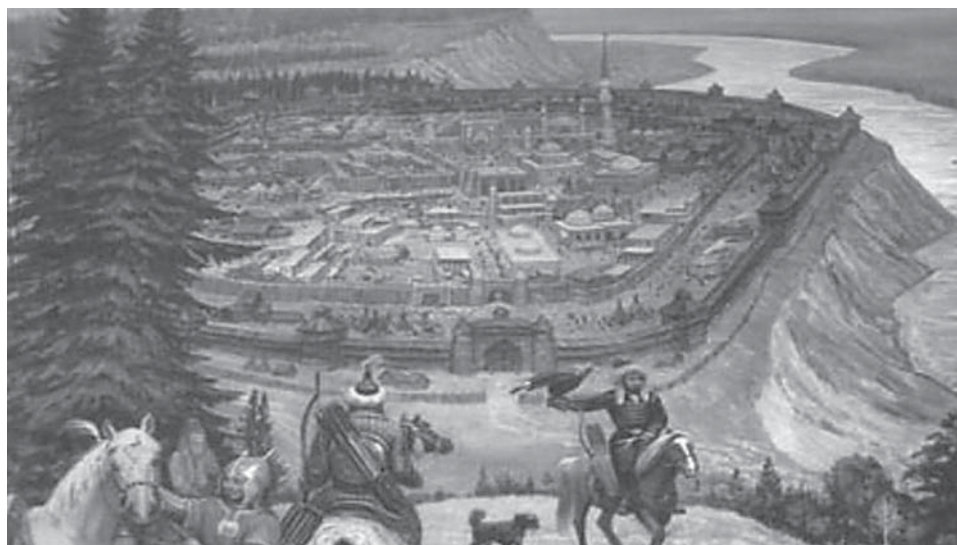
Столица сибирского ханства Искер

Миссия Лещинского была в основном направлена на крещение северных наро-