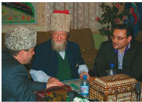
Верховный муфтий, председатель ЦДУМ России шейх Талгат Таджуддин, председатель Исламского культурного центра России Абдул-Вахед Ниязов, муфтий Чечни Султан Мирзаев. Участники за обсуждением.

– Мы в Совете муфтиев России с большим удовлетворением встретили благую весть, пришедшую к нам из Уфы и исходящую от председателя и верховного муфтия Центрального духовного управления мусульман России Талгата Таджуддина. Его призыв к единению российских мусульман отвечает чаяниям миллионов верующих по всей стране. Мусульмане России на протяжении десятилетий стремились обрести утраченное после развала Советского Союза единство, поскольку стремление к единению исламской уммы предписано в качестве обязанности веру-