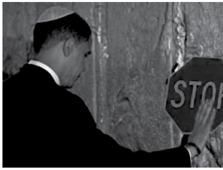
История Израиля, в том виде, как он существует, объективно заканчивается