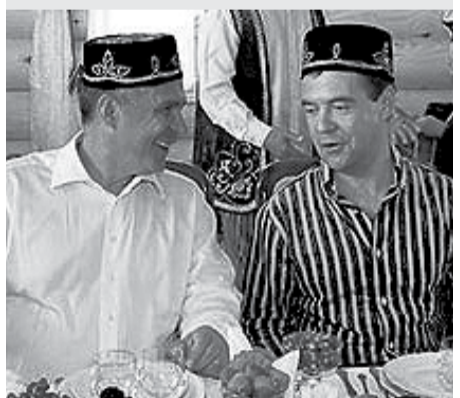
За столом с разнообразными яствами местной кухни

Главы России и Татарстана побывали в импровизированном татарском доме, где они сразу одели тюбетейки — национальный головной убор, посидели за столом с разнообразными яствами местной кухни. Дмитрия Медведева угостили чак-чаком и казы (конской колбасой), также он выковал подкову.