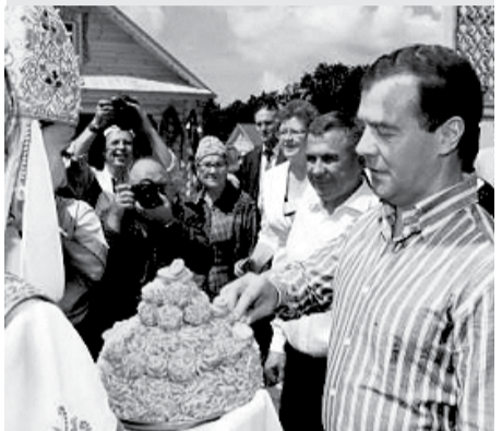
Есть такая татарская традиция — президентов кормить

Президент Дмитрий Медведев, принявший участие в татарском празднике Сабантуй, пожелал всем сохранить тот запас энергии, который подпитывает татарскую культуру, а теперь и культуру всей нашей страны, на весь год.