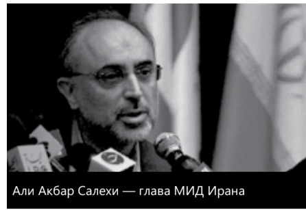
Али Акбар Салехи — глава МИД Ирана

Салехи подтвердил, что его страна полностью привержена Договору о нераспространении ядерного оружия (ДНЯО). «Иран является членом МАГАТЭ, верит в эту организацию и настаивает на том, что ислам и ядерное оружие несовместимы», — сказал министр. По его словам, Тегеран «поддерживает очень хороший, высокий уровень сотрудничества с МАГАТЭ», наблюдающей за осуществлением иранской ядерной программы.