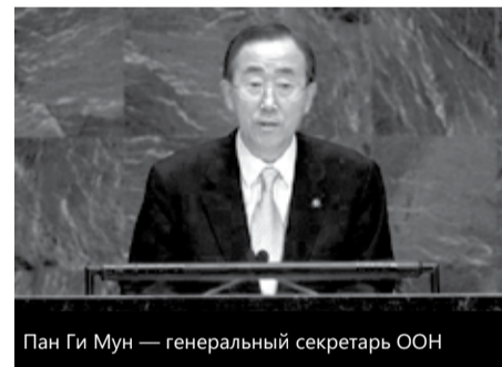
Пан Ги Мун — генеральный секретарь ООН

Пакистан направил обращение к генеральному секретарю ООН Пан Ги Муну в связи с проведенной в американском штате Флорида символической церемонией «казни» Корана, сообщает The Indian Express.