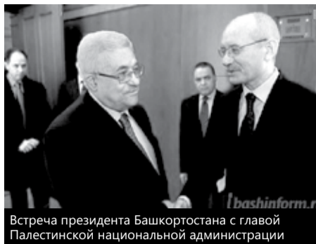
Встреча президента Башкортостана с главой Палестинской национальной администрации

администрации рассказал, что год назад на встрече с Президентом России Дмитрием Медведевым он выразил желание посетить Республику Башкортостан. Дмитрий Медведев назвал это прекрасным выбором. Махмуд Аббас отметил, что сегодня, находясь в республике, он понимает, что такие встречи надо продолжить в будущем. «Башкортостан является примером сотрудничества народов всех конфессий, это — образец мирного сосуществования», — подчеркнул он.