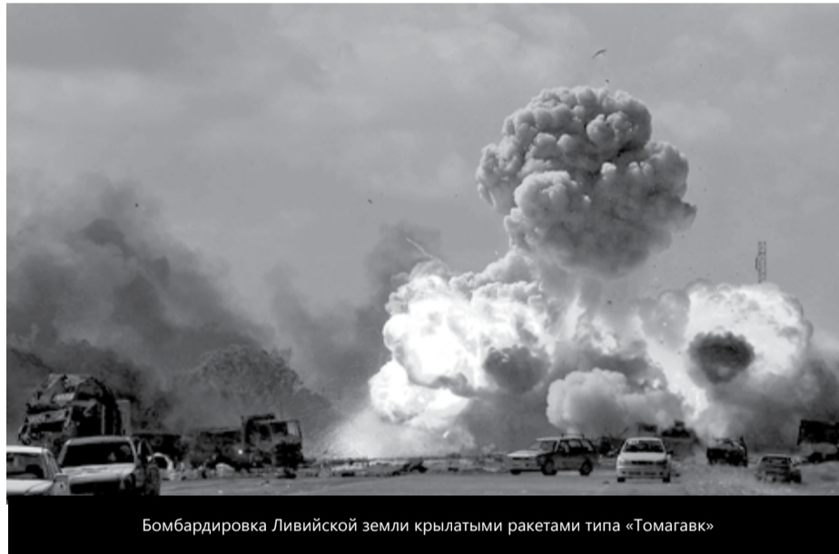
Бомбардировка Ливийской земли крылатыми ракетами типа «Томагавк»