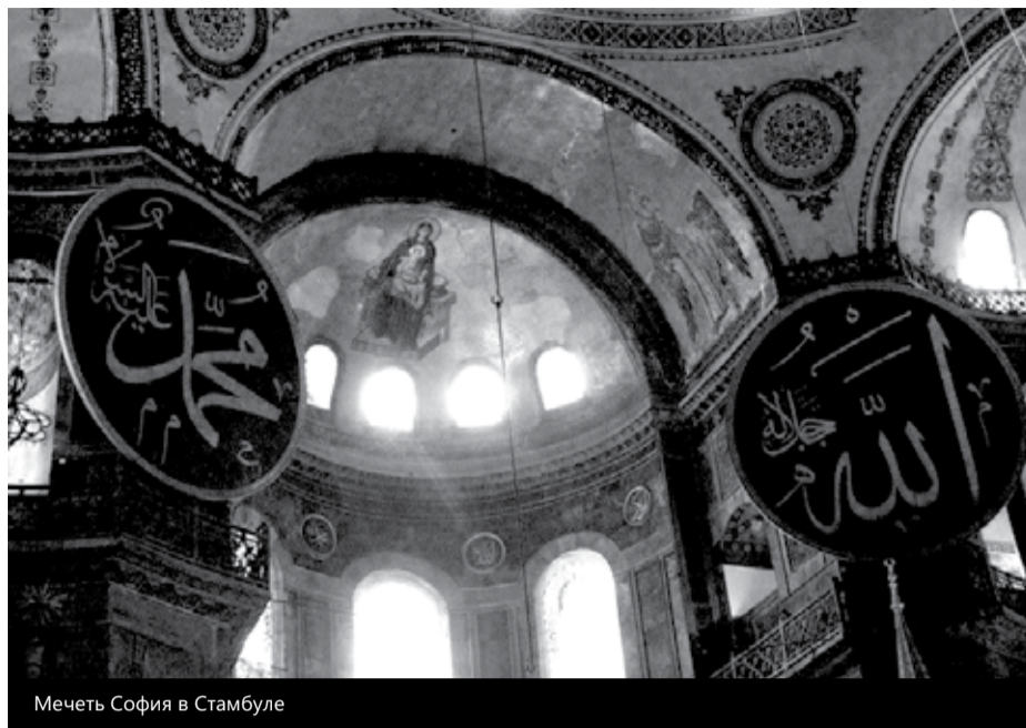
Мечеть София в Стамбуле

1. Отрицающим бытие Божие и утверждающим, яко мир сей есть самобытен и вся в нем без промысла Божия